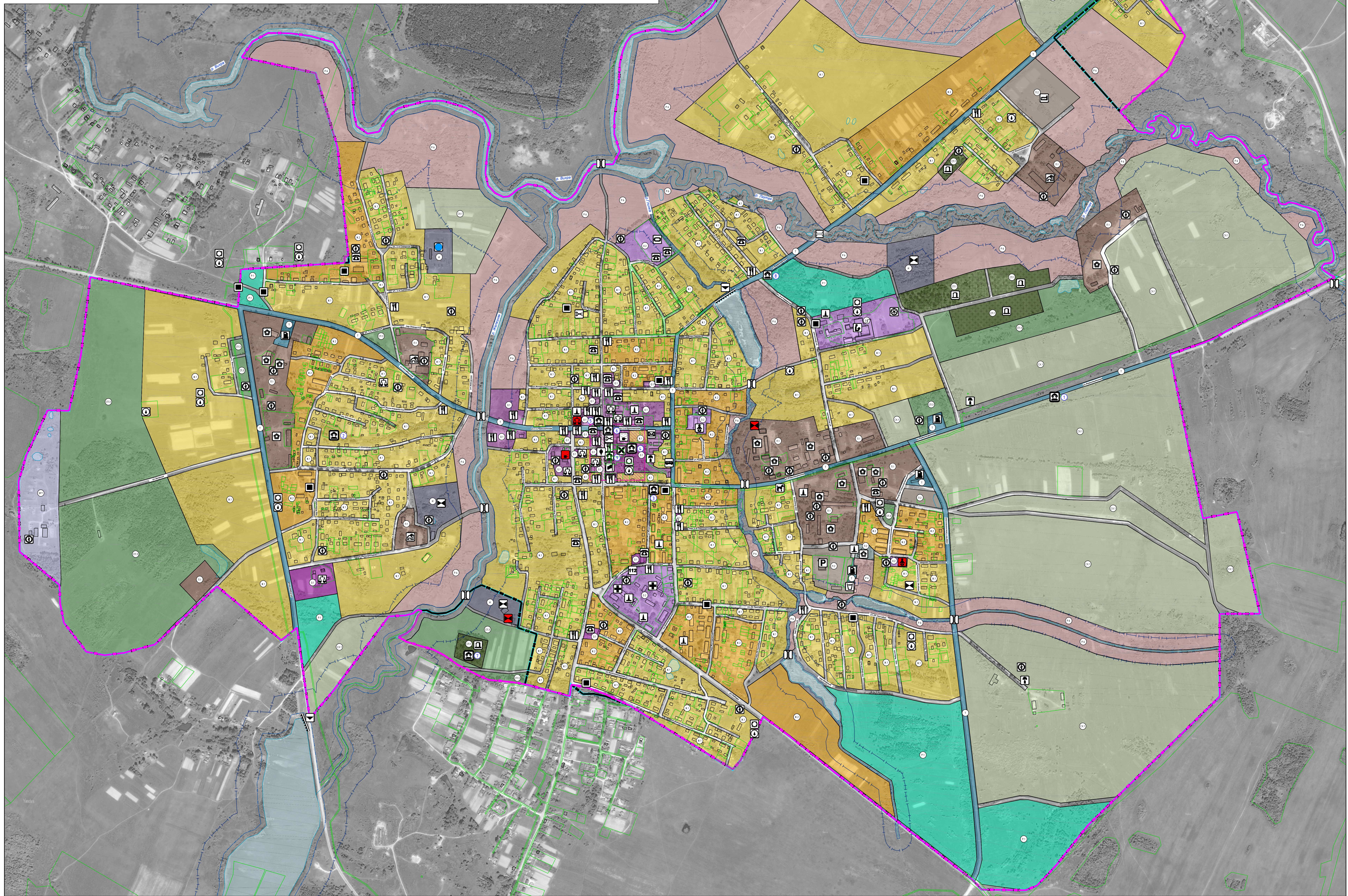
Схема расположения Монастырщинского городского поселения в Монастырщинском районе Смоленской области